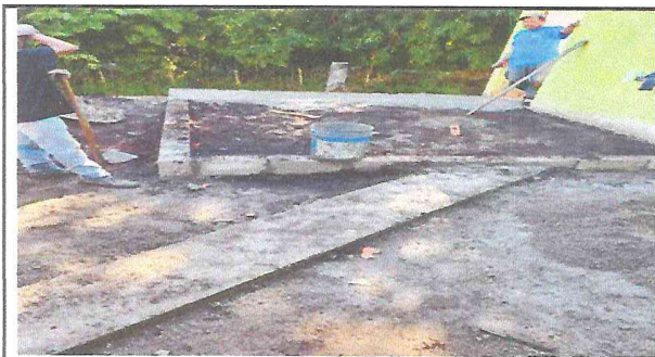
Sustitución de torta para colocar piso de granito