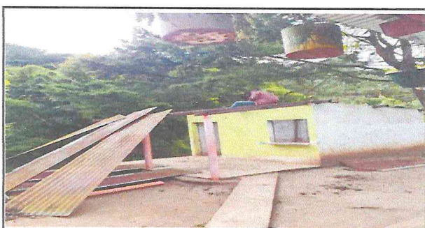
Retirada de lámina y estructura de metal

Observación: Si es necesario se pueden agregar hojas adicionales y actualizar el número de hojas.