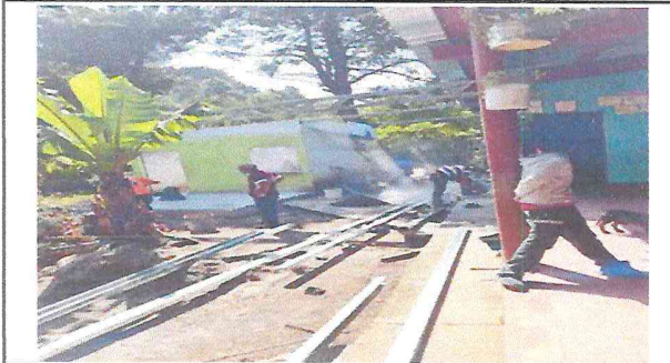
Colocación de estructura de metal