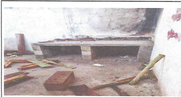
Sustitución de hornilla en proceso